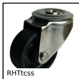
RHTccss Roulette Hautes températures, jusqu'à 200kg