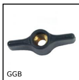
GGB Ecrin à oreilles, Taraudage traversant