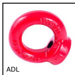
ADL Anneau de levage haute résistance, haute résistance