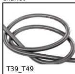
T39_T49 Ressort de traction au mètre acier, au mètre