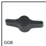
GGB Ecrin à oreilles, Borgne