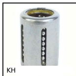
KH Douille à billes compacte, Légère