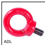
ADL Anneau de levage haute résistance, haute résistance