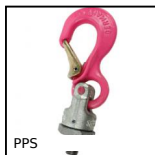
PPS Anneau de levage, Crochet universel à visser