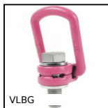
VLBG Anneau de levage, Arqué à étrier