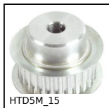
HTD5M_15 Poulie dentée de transmission type HTD, HTD5 Acier