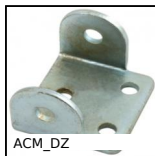
Chape pour attache- capot manuelle, Chape