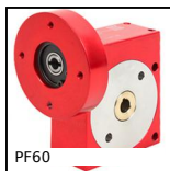
Réducteur à roue et vis sans fin, jusqu'à 118 Nm