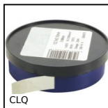
Clinquant en rouleau largeur 12,7mm, Clinquant en rouleau