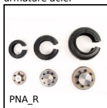
Bandage de rechange PERIFLEX®, Bandage de rechange