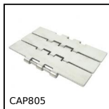
Chaîne à palette droite, Large série 805