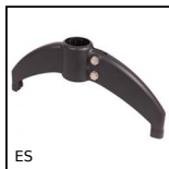
Bipode simple, Plastique