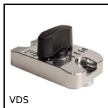
Système de réglage par verrou coulissant, Verrou coulissant pour t...