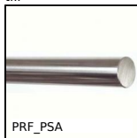
Arbre pour guidage linéaire, Arbre pour guidage