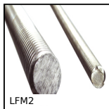
LFM2 Tige trapézoïdale acier, 2 filets acier mi- dur