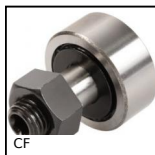
CF Galet de came, Standard - acier