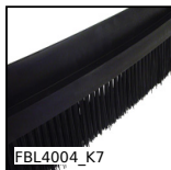
FBL4004_K7 Brosse au mètre, Polyamide - moyenne taille