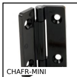
CHAFR-MINI Charnière à friction miniature, A friction