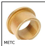
METC Coussinet bronze fritté à collerette, Bronze auto-lubrifiant