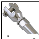
ERC Embout rapide inox pour câble, Chape