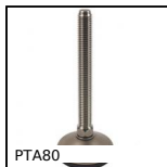
PTA80 Pied articulé à embase tôle Ø80, Ø 80