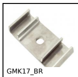
GMK17_BR Bride pour profil de guidage, Conique double