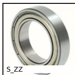
S_ZZ Roulement à billes à contact radial, Inox