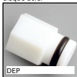
DEP Insert de protection Hygienic Usit® et Hygienic Design®, Insert de protection