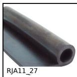
RJA11_27 Joint d'étanchéité linéaire, Autre que clipsage