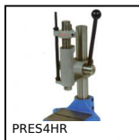
PRES4HR Presse manuelle d'établi, Pression jusqu'à 600kg