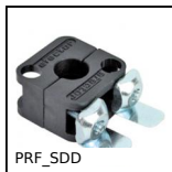
PRF_SDD Support de détecteur Ø12, Ø12