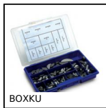
BOXKU Coffret de clavettes disque NFE22179, Coffret clavettes disque acier