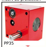
PP35 Réducteur à roue et vis sans fin, de 2,20 à 4,10 Nm