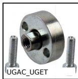
UGAC_UGET Guidage de vérin en kit, Accouplement pour tige de vérin filetée