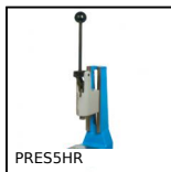
PRES5HR Presse manuelle d'établi, Pression jusqu'à 500kg