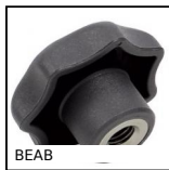
BEAB Bouton étoilé antibactérien, Etoile, antibactérien