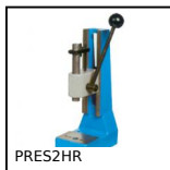
PRES2HR Presse manuelle d'établi, Pression jusqu'à 200kg