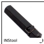
INStool Insert auto-taraudeur - outil, Outil de pose