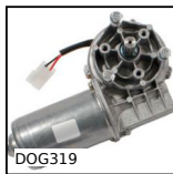
DOG319 Motoréducteur 12V et 24V DC, de 4 à 9 Nm