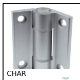
CHAR Charnière à ressort à visser, à visser