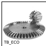
TB_ECO Engrenage conique série éco., 3:1