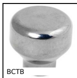
BCTB Bouton champignon Hygienic Usit®, avec taraufrage - collerette