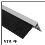
STRIPF Brosse d'étanchéité en baguette, Longueur 1m