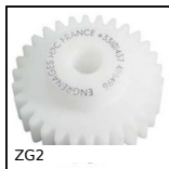
ZG2 Engrenage droit plastique, Plastique usiné (delrin)