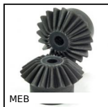
MEB Engrenage conique plastique, 1:1