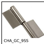
CHA_GC_9SS Paumelle à ailettes à souder, A souder