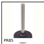
PR85 Pied à rotule, Ø 83