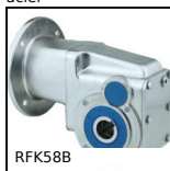
RFK58B Réducteur hypôide inox, jusqu'à 500Nm