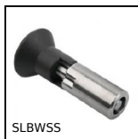
SLBWSS Bouton d'indexage, Inox à souder