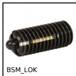
BSM_LOK Poussoir Long-Lok à 6 pans creux, LONG- LOK - corps et doigt acier