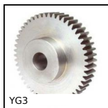
Engrenage droit PERFORMANCE, Acier 35NCD6