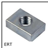
Ecroû plaquette, Pour rainure en T