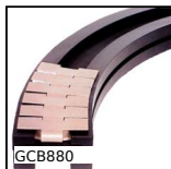
GCB880 Guide courbe pour chaîne à palettes, Séries 880 et 881