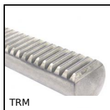
TRM Crémaillère section circulaire, Acier - module 1-6