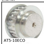
AT5-10ECO Poulie dentée de positionnement type AT, Série économique - AT5 a...