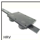
HRV Système de guidage sur rail en V Simple Select®, Rail avec chariot