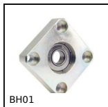
BH01 Bride avec roulement, Montage serré collé