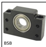
Bloc palier pour vis à billes, Bloc palier