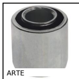
ARTE Articulation élastique, Charge multi- directionnelle