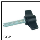
GGP Vis à oreilles, Technopolymère insert acier