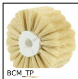
BCM_TP Brosse cylindrique modulaire, Fil Tampico