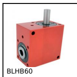
BLHB60 Renvoi d'angle, jusqu'à 70 Nm