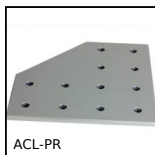
Plaque de liaison pour profilé aluminium, Connexion à angle droit