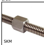
Ecroû hexagonal acier, 1 filet acier