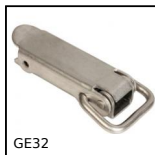
Grenouillère rigide à anneau, Standard