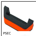
PSECC Poignée de manutention, Thermoplastique