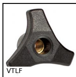
Petit volant femelle à 3 lobes, Polyamide - Laiton