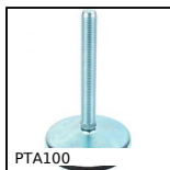
Pied articulé à embase tôle Ø100, jusqu'à 15000N