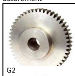
G2 Engrenage droit acier, Acier 20NCD2