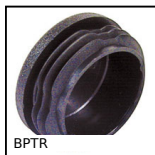
Bouchon pour tube rond, Simple