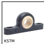
KSTM Palier à chapeau Igubal®, Polymère