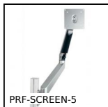
PRF-SCREEN-5 Support d'écran, Support 5 axes