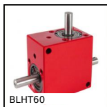
Renvoi d'angle, de 26 à 70 Nm