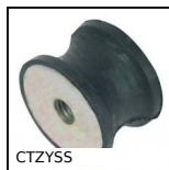
CTZYSS Amortisseur élastique inox diabololo, Inox