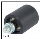
GTC Galet tendeur pour courroie, Pour applications