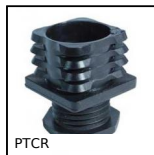
PTCR Pied d'ameublement réglable, tube carré