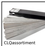
CLQassortiment Cliquant en assortiment, Cliquants en assortiment