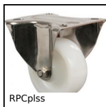
Roulette fixe à platine, Inox - Polyamide