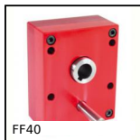
FF40 Réducteur à arbres parallèles, de 59 à 210 Nm