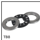
BT8 Butée à rouleaux cylindriques, Acier