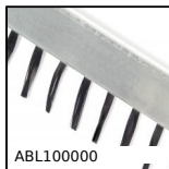
Brosse antistatique, Pour surfaces sensibles