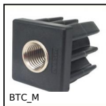
BTC_M Bouchon taraudé pour tube carré, Avec insert taraudé