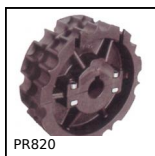
PR820 Roue de renvoi, Séries 820 et 815