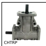
CHTRP Réducteur à renvoi d'angle en L ou T, Jusqu'à 87,3 Nm