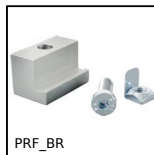
PRF_BR Bride pour profilé aluminium, Bride pour profilé