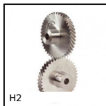
H2 Engrenage hélicoïdal axes croisés, Acier 20NCD2