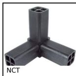
NCT Noix de connexion, A angle fixe