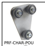
PRF-CHAR-POU Chariot porte-outils pour profilé alu., Chariot porte-outils