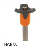
BABss Broche à billes inox 303, Inox 303