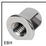
EBH Ecrou borgne avec embase Hygienic Usit®, Avec embase