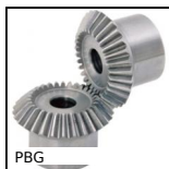
PBG Engrenage conique de précision, 1:1