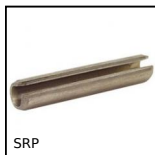
SRP Goupille élastique fendue ISO 8752, élastique fendue ISO 8752