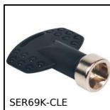
SER69K-CLE Verrou quart de tour pour agroalimentaire, Clé inox