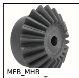
MFB_MHB Engrenage conique plastique moulé (nylon), 1,5:1