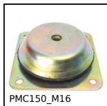
PMC150_M16 Pied de machine antivibratoire, Plaque de base carrée