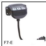
F7-E Afficheur multifonction, Avec capteur externe