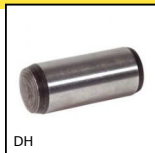
DH Goupille pleine, standard DIN 6325