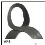
VEL Bande auto-agrippante pour câble,