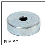
PLM-SC Aimant plat avec trou fraisé, Avec trou fraisé