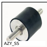
AZY_SS Amortisseur élastique cylindrique inox, Inox