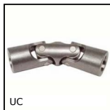
UC Cardan acier, Double