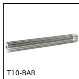
T10-BAR Barreau denté type T, T10