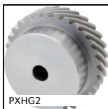
PXHG2 Engrenage hélicoïdal axes croisés de précision, Acier 20NCD2 cémenté trempé