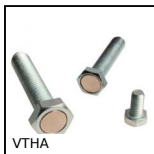
VTHA Vis aimantée à tête hexagonale, Acier