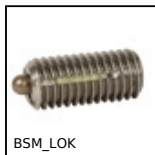
Poussoir ressort - doigt de maintien, LONG-LOK - corps et doigt inox 303