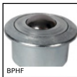
Bille porteuse, Forte