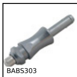
Broche à billes, Inox 303