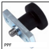
Bouton d'indexage, à bride