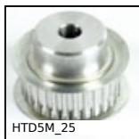
Poulie type HTD pour courroie RPP, HTD5 Aluminium