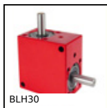
Renvoi d'angle, de 1,32 à 4,40 Nm