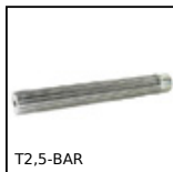
Barreau denté, T2,5