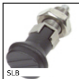
Bouton d'indexage, inox