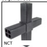
Noix de connexion, A angle fixe