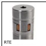
Rotex®, élastique, fonte