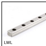
Glissière linéaire à billes inox, Rail - de 514 N à 16700 N