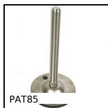
PAT85 Pied articulé tôle emboutie, Ø 85