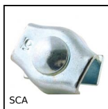
SCA Serre-câble plat, Acier