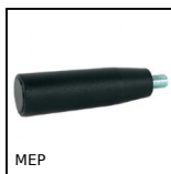
MEP Poignée tournante cylindrique, Fixe