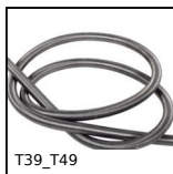
T39_T49 Ressort de traction, au mètre