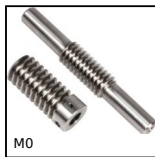
M0 Couple roue et vis sans fin, Acier non trempé