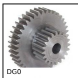
DGO Engrenage double, Acier 20NCD2