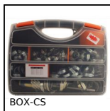
BOX-CS Coffret de collier de serrage, Coffret colliers acier