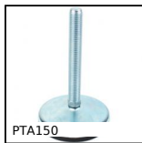
PTA150 Pied articulé à embase tôle Ø150, Ø 150