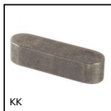
KK Clavette rectangulaire, Acier