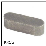
KKSS Clavette, Inox