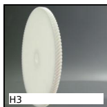
H3 Engrenage hélicoïdal axes croisés, Plastique usiné (delrin)