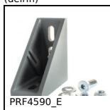
PRF4590_E Equerre pour profilé aluminium, PRF4590