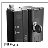
PRFsra Serrure pour profilé aluminium, Serrure avec capteur de sécurité