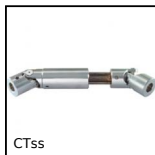
CTss Cardan télescopique inox, industrie