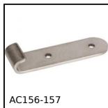
AC156-157 Crochet pour grenouillère rigide, 25,5mm