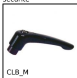
CLB_M Manette indexable Zamak, Zamak