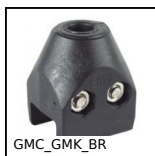
GMC_GMK_BR Bride pour profil de guidage, Plat ou conique