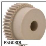
PSG08DL Engrenage droit de précision, Peek