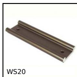
WS20 Rail Drylin® W, Rail