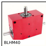
BLHM40 Renvoi d'angle, jusqu'à 10,3 Nm