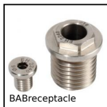
BABreceptacle Réceptacle pour broche à billes, Réceptacle