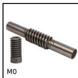
M0 Couple roue et vis sans fin, Acier trempé