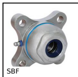
SBF Palier applique étanche agro- alimentaire, ouvert