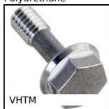
VHTM Vis H à tige mince Hygienic Design®, Inox