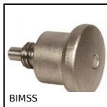
BIMSS Bouton d'indexage miniature, miniature inox