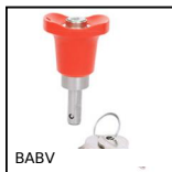
BABV Broche à billes verrouillable, Inox