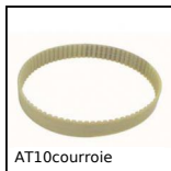
AT10courroie Courroie de positionnement type AT, AT10 Polyuréthane