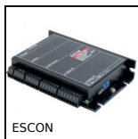
ESCON Variateur de vitesse 5A, 5 A