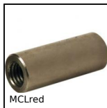
MCLred Manchon réducteur femelle/femelle, Cylindrique - acier