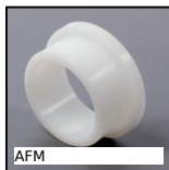
AFM Coussinet polymère à collerette, Polymère alimentaire