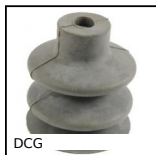
DCG Ventouse 2,5 soufflets, caoutchouc naturel