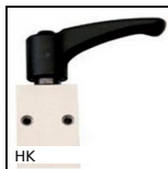
HK Accessoire de serrage manuel, Serrage manuel T