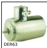
DER63 Moteur AC asynchrone triphasé inox, 0,18kW