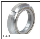
EAR Ecrrou autofreiné pour roulement, Ecrrou autofreiné - rondelle nylon