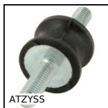
ATZYSS Amortisseur élastique inox diablo, Inox