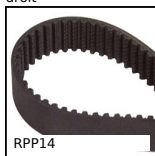
RPP14 Courroie pour transmission RPP, RPP14