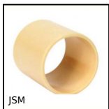
JSM Coussinet polymère cylindrique, Polymère universel