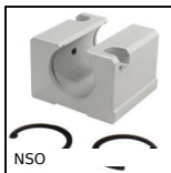
NSO Palier standard pour douille à billes ouverte, Ouvert long