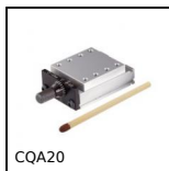
CQA20 Chariot de réglage miniature, 20