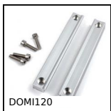
DOMI120 Accessoires de liaison, Kit de fixation