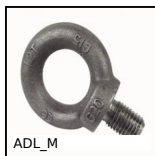
ADL_M Anneau de levage mâle DIN580, Acier