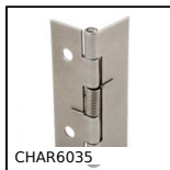
CHAR6035 Charnière à ressort, à visser et à souder