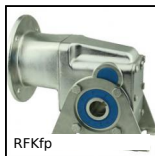
RFKfp Pied support inox, Pied support