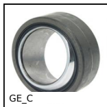
GE_C Rotule lisse, Chrome dur / PTFE