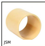
JSM Coussinet polymère cylindrique, Polymère universel