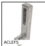
ACLEFS Ancrage pour profilé aluminium, Standard