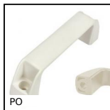
PO Poignée de manutention multi-secteurs, Trou lisse