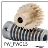
PW_PWG15 Roue de précision, Bronze