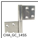
CHA_GC_14SS Paumelle à ailettes à visser, A visser