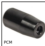
PCM Poignée cylindrique fixe, Poignée non tournante