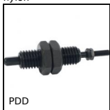
PDD Pousoir de détection, Avec axe de détection anti-rotation