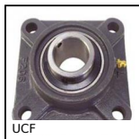
UCF Palier applique fonte, Fonte