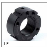
LF Ecrrou de réglage et de serrage, Ecrrou de réglage