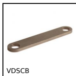
VDSCB Système de réglage par verrou coulissant, Câle de blocage pour ve...