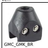
GMC_GMK_BR Bride pour profil de guidage, Plat ou conique