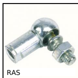
RAS Embout à rotule à 90° DIN71802, Acier