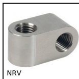
NRV Noix de renvoi orthogonale, Noix de renvoi orthogonale