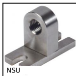
NSU Noix support universelle à 90°, Noix support universelle à 90°