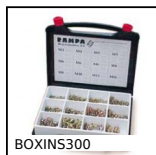
BOXINS300 Coffret inserts auto- taraudeurs, Coffret - pour matériaux durs