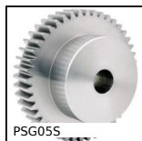
PSG05S Engrenage droit de précision, Inox 303