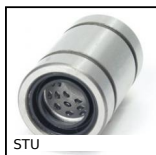
STU Douille à billes linéaire et rotative, Acier