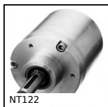
NT122 Réducteur coaxial à trains parallèles, de 32 à 85 Nm - à trains...