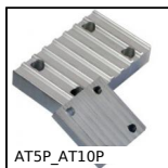
AT5P_AT10P Plaque de jonction type AT, AT10