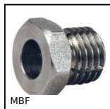
MBF Manchon fileté de blocage, Manchon fileté de blocage