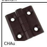
CHAU Charnière en façade, Ouverture 270 degrés