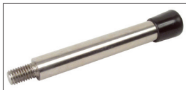
Avec axe de fixation APB