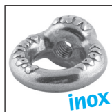
Anneau de levage inox