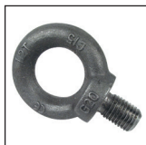
Anneau de levage acier