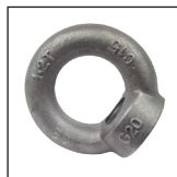
Anneau de levage acier