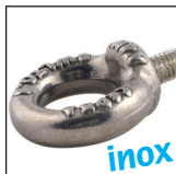
Anneau de levage inox