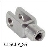
Chape série courte inox, Courte inox