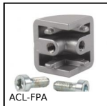
Accessoires pour panneau, Raccord angulaire