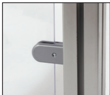
Exemple d'application ACL-FPA-BM