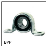
Palier tôle à charge légère, Tôle