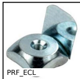
Ecrou pour profilé aluminium, Ecrou carré à languette acier