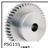
Engrenage droit de précision, Inox 316