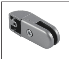
ACL-FPA-BM + ACL-FPA-RA