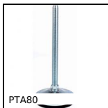
Pied articulé à embase tôle Ø80, Ø 80