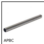
Tube rond pour noix, Tube rond pour noix