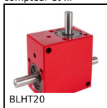
Renvoi d'angle, de 0,66 à 1,77 Nm