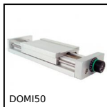
Chariot de réglage Domino 50, Chariot DOMILINE 50 avec compteur et ...