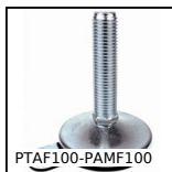
Pied articulé à embase tôle à fixer Ø100, Ø 100