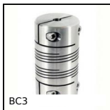
Panamech Multi-Beam inox, Inox - avec mâchoires de serrage