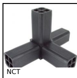
Noix de connexion, A angle fixe