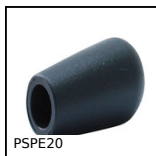
Poignée souple Ø20 pour arbre, PVC noir