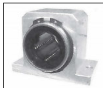
Exemple de montage