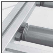
Exemple de montage avec la butée PRF-BP (tome 5 p.382)