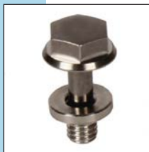
Rondelle avec vis VHTM