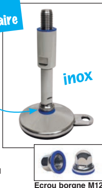
Ecrou borgne M12