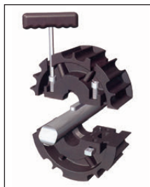
Montage en demi-coques