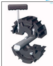
Montage en demi-coques