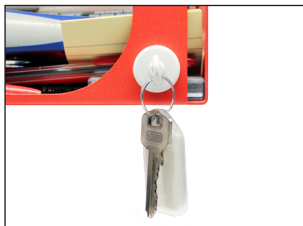
Exemple d'application : portant à clefs