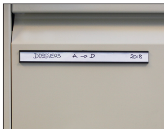
Exemple d'application sur un casier administratif