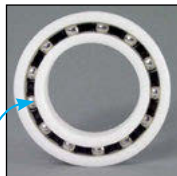
SS : billes inox