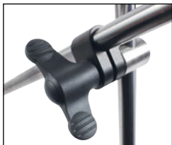
Exemple de montage