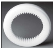
ZIN : Plastique