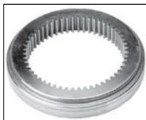
IN : Acier