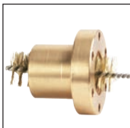
Ebavurrage d'un écrou trapézoïdal