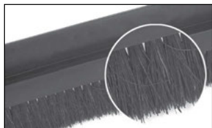
Fibres en crin de cheval