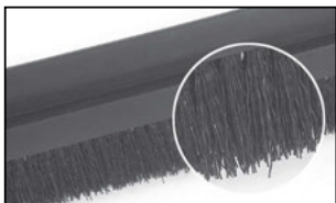
Fibres en PP