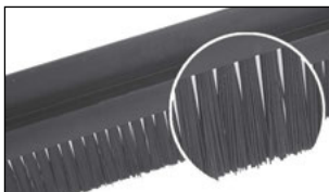
Fibres en PA6