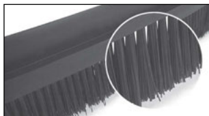
Fibres en PA6