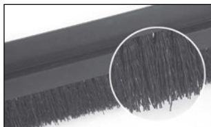
Fibres en PP