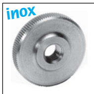
Version basse EMS-B