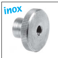
Version haute EMS-H