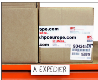
Exemple d'application sur des racks en entrepôt