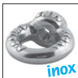
Anneau de levage inox