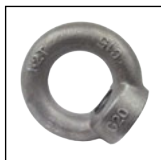
Anneau de levage acier