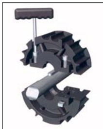
Montage en demi-coques