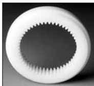
ZIN : Plastique