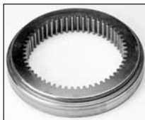
IN : Acier