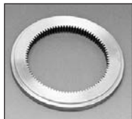
IN : Acier