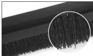
Fibres en PP