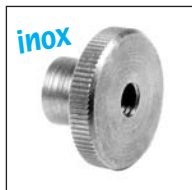
Version haute EMS-H