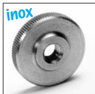
Version basse EMS-B