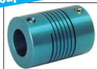
C-Flex : BFC